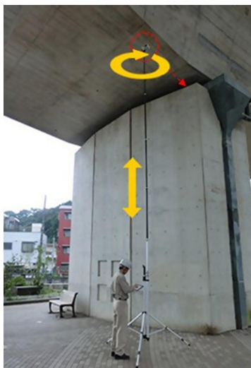
【 橋梁等構造物の点検ロボットカメラ BR010019-V0625 】

点検費用については、当該2施設に対して新技術を活用し、安全性の向上及び約10,000円程度のコスト縮減を目指す。